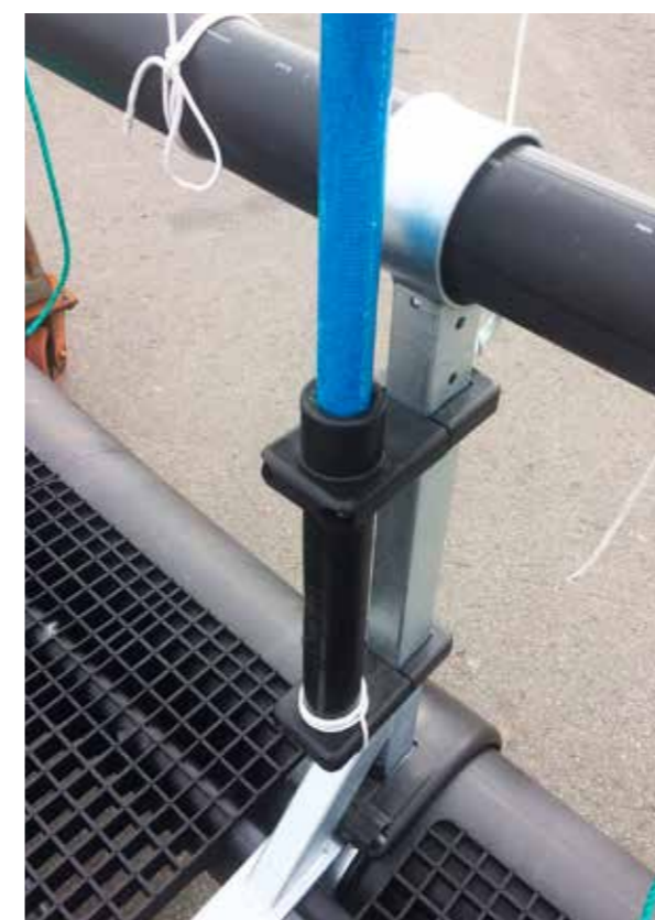
Innvendig tauføring i stenger.

Aqualine sine fuglenettstenger er laget i glassfiberarmert polyester (GFRP), og er utviklet basert på analyser og testing. Sammen med stengene leveres dedikerte fester og trinser for innfesting til klammer og fuglenett.