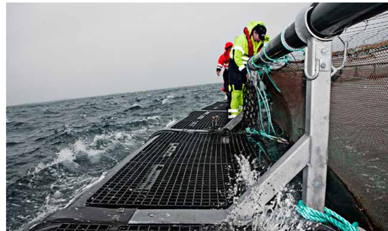
Gangbaner – helse, miljø og sikkerhet.